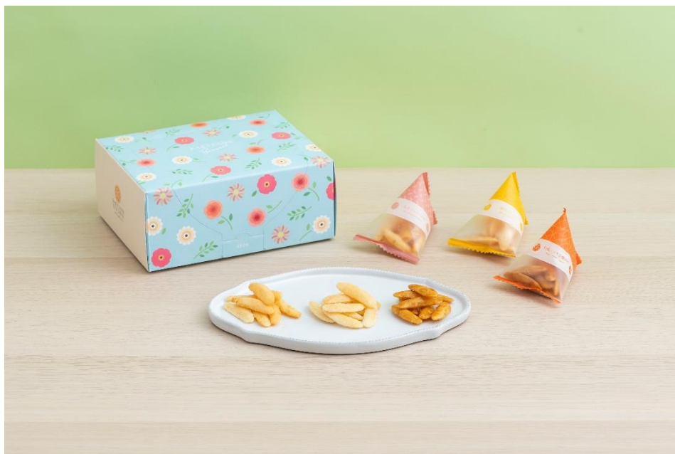
限定デザインの「ありがとうボックス」に入った『かきたねミックスパック』

また、ハロウィン、クリスマスなど季節やイベントに合わせた限定デザインの専用ボックスを年3回用意しており、季節感を演出する逸品としてご利用いただけます。なお、第1弾として、2022年5月4日から限定デザインの「ありがとうボックス」を発売いたします。