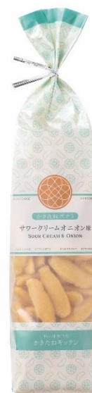
上：かきたねキッチン サワークリームオニオン味