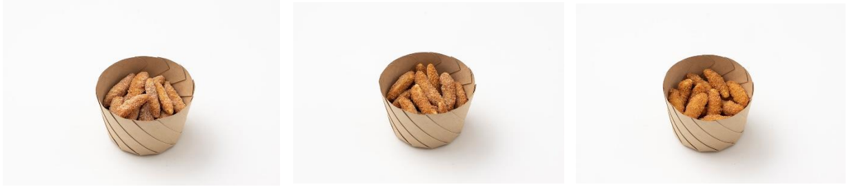
左から：できたてかきたね 贅沢チーズ 海鮮風塩だれ プレーンソルト